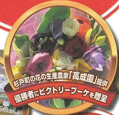
優勝者にピクトリーブーケを贈呈