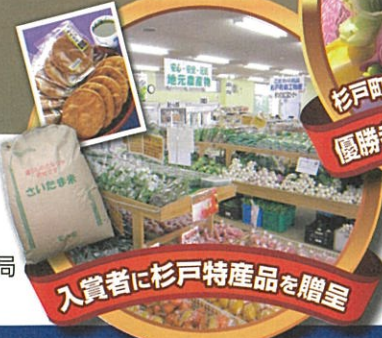
入賞者に杉戸特産品を贈呈