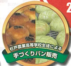
杉戸農業高等学校生徒による手づくりパン販売